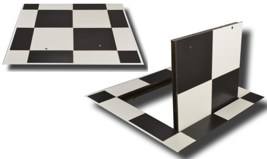
Схема монтажа люка и укладки плитки на люк