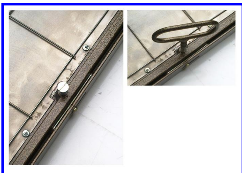
Схема монтажу люка и укладки плитки на люк